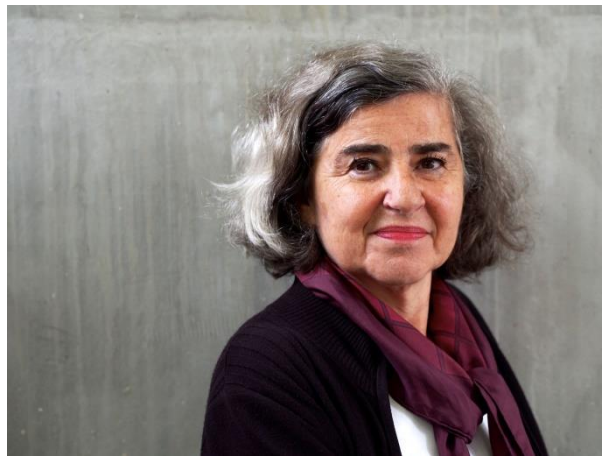
Barbara Honigmann 2014

Barbara Honigmann wurde 1949 in Ost-Berlin geboren. Sie arbeitete als Dramaturgin und Regisseurin. 1984 emigrierte sie mit der Familie nach Straßburg, wo sie noch heute lebt. Honigmanns Werk wurde mit zahlreichen Preisen ausgezeichnet, u. a. dem Heinrich-von-Kleist-Preis, dem Max-Frisch-Preis der Stadt Zürich, zuletzt 2018 mit dem Jakob Wassermann-Preis. Bei Hanser erschienen Damals, dann und danach (1999), Alles, alles Liebe! (Roman, 2000), Ein Kapitel aus meinem Leben (2004), Das Gesicht wiederfinden (2007), Das überirdische Licht (Rückkehr nach New York, 2008), Bilder von A. (2011) und Chronik meiner Straße (2015).